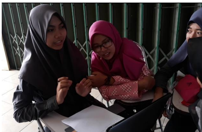
Gambar 3. Mahasiswa Menjelaskan Cara Membuat Grafik

Kemudian mahasiswa melakukan kegiatan membentuk jejaring. Pada kegiatan ini, mahasiswa dapat menyimpulkan, menyajikan, dan mengkomunikasikan. Dalam menyimpulkan, mahasiswa dapat menyimpulkan mengenai cara membuat grafik persamaan linier. Dengan mengetahui hubungan antara grafik dan point tables , mahasiswa dapat menyimpulkan bahwa untuk membuat grafik persamaan linier dapat dilakukan dengan cara menentukan titik-titik potongnya. Selain itu, ada juga yang menjelaskan bahwa untuk membuat grafik tersebut dengan cara mensubstitusi nilai x sehingga nantinya ditemukan nilai y dan ditemukan beberapa titik (x, y) seperti pada gambar 3.