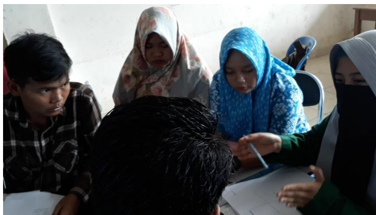
Gambar 6. Percakapan dalam Menyelesaikan LKM

Pada LKM yang ketiga, mahasiswa menyelesaikan permasalahan mengenai cara membuat grafik fungsi akar dalam bentuk y = \sqrt[n]{ax + b} . Langkah-langkah yang dilakukan sama seperti pada kedua LKM sebelumnya. Pada kegiatan mengamati, mahasiswa mengamati grafik fungsi akar dengan point tables yang ada pada software graphmatica . Dalam hal ini, terjadi percakapan antara sesama mahasiswa dan dosen seperti gambar 6 berikut.